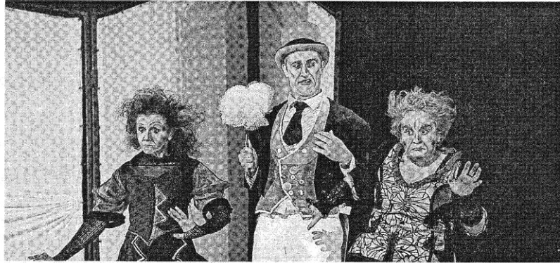
Après La Roche-sur-Yon, « Ah ! Anabelle » sera présentée en Espagne en mars, ainsi qu'au festival d'Avignon dans le cadre de l'opération « Grenier à sel ».