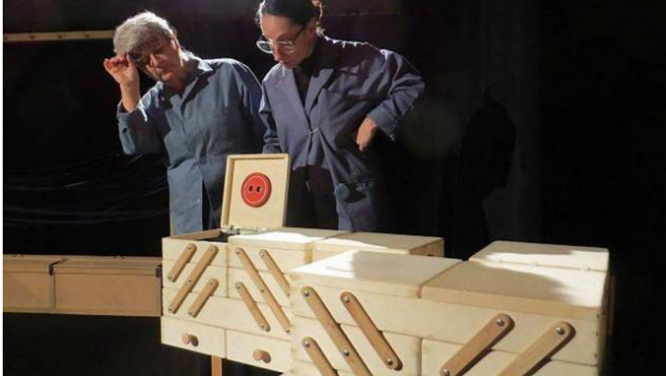
La Compagnie Grizzli Philibert Tambour ouvre le bal du festival Cep Party, lundi. |

Le rideau se lève ce lundi sur la onzième édition du festival Cep Party. En résidence au Champilambart, la compagnie vendéenne Grizzli Philibert Tambour démarre le festival.