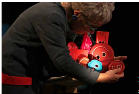
La petite histoire du bouton rouge.

Née en 1990 à La Roche-sur-Yon sous le nom de « Grizzli Philibert Tambour », la compagnie Grizzli crée et diffuse ses spectacles de théâtre d'auteurs contemporains, principalement en direction du jeune public. Elle intervient régulièrement auprès des troupes de théâtre amateurs, des établissements scolaires, des associations culturelles, mais aussi des entreprises, des collectivités territoriales, et organise également chaque année des ateliers d'initiation ou de perfectionnement au jeu dramatique à destination des enfants (dès 7 ans), des adolescents et des adultes, encadrés par des comédien(ne)s professionnel(le)s/metteurs(euses) en scène**.